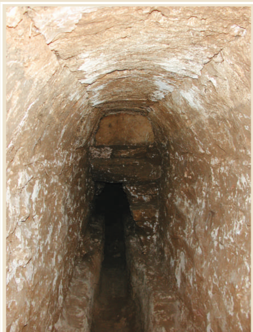
► Η είσοδος της σήραγγας του αρχαίου υδραγωγείου