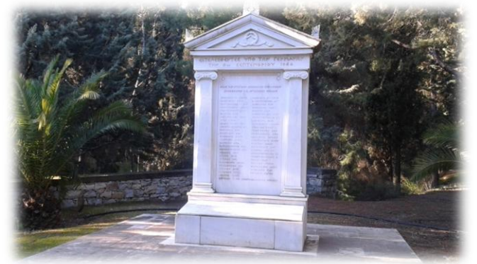
Μνημείο των Ηρώων στην Ν.Α. πλευρά του Κήπου