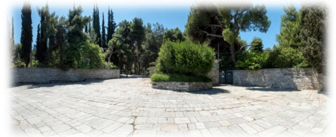
Κεντρική είσοδος του Βοτανικού Κήπου Διομήδους