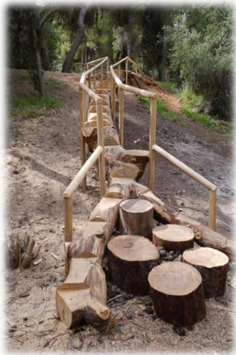
Δενδρογέφυρα στον Δενδρώνα