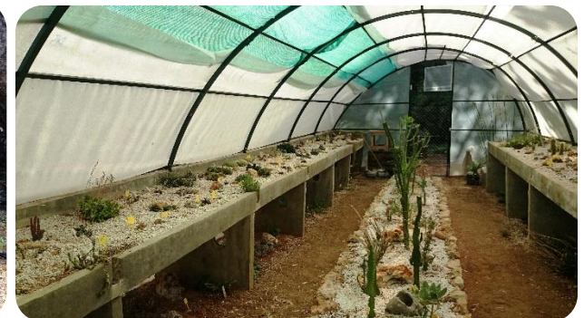
Θερμοκήπιο με κάκτους