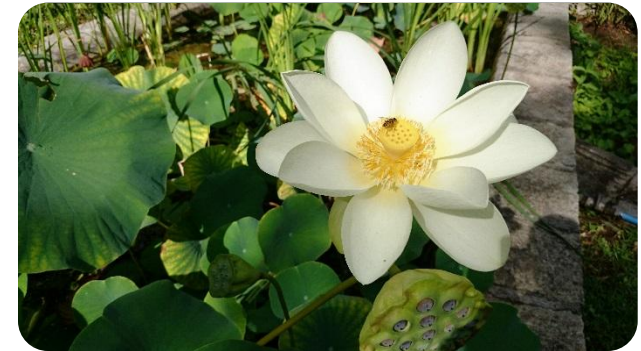
Λίμνη με λωτούς

ΒΟΤΑΝΙΚΟΣ ΚΗΠΟΣ ΙΟΥΛΙΑΣ & ΑΛΕΞΑΝΔΡΟΥ Ν. ΔΙΟΜΗΔΟΥΣ ΚΟΙΝΩΦΕΛΕΣ ΙΔΡΥΜΑ ΙΕΡΑ ΟΔΟΣ 403 – ΧΑΪΔΑΡΙ