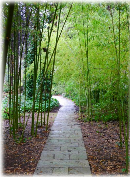
Μπαμπού στον Ανθώνα