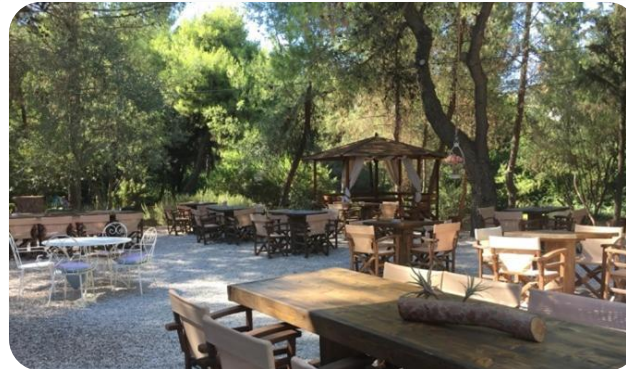
Κυλικείο/ καφετέρια στην είσοδο του Κήπου