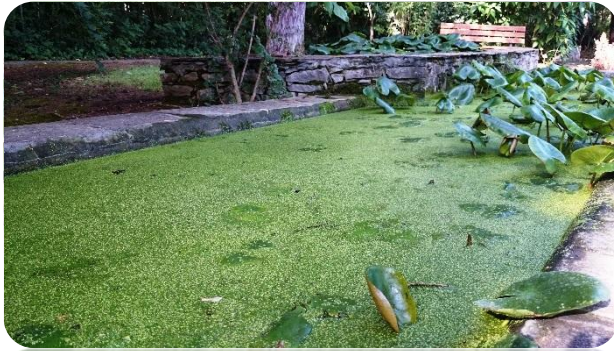
Μία από τις λίμνες του Κήπου